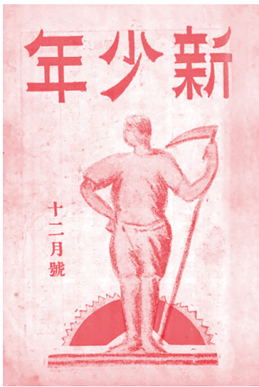
[그림 5] 이주홍, 『신소년』, 1929년 12월호, 서울대학교 중앙도서관