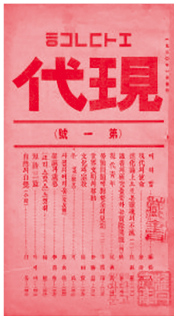
[그림 2] (왼쪽) 『기독청년』 제7호, 1918.5., 연세대학교 국학도서관, (오른쪽) 『현대』 제1호 1월호, 1920, 현담문고

그것을 감각적으로도 독자들에게 전달하기 위해 기하학적 디자인을 의도적으로 활용한 것으로 보인다. 그 사례로 1922년 3월에 창간된 『신생활』은 사회주의자 김명식과 박희도, 이승준 등 비타협적 민족주의자 3) 들이 함께 서울 신생활사를 조직하여 사회주의를 대중 앞에 공표한 최초의 잡지였다. 이 간행물은 순간(旬刊)으로 간행되다가 제6호부터 월간으로 전환되었다. 1922년 9월에 발행된 『신생활』 9호는 10호(11월 발행)로 넘어가면서 잡지의 판형, 간행 주기, 기사 논조를 포함하여 전체적인 변화를 보였고 이는 곧 표지디자인의 변화에서 완성된다. [그림 1]