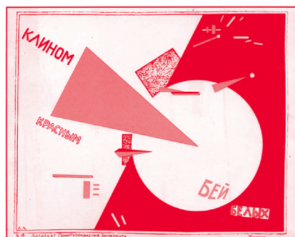
[그림 11] 엘 리시츠키, 『붉은 뿔기로 백색을 쳐라』, (1919)