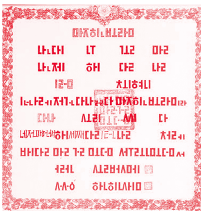
[그림 3] 한글교육수료증 「마친보람」, 1911, 국가기록원

채워 목적한 무게감이 강조되었다. 10호에서는 표제가 기계적으로 정제되어 한자라는 점 말고는 9호에서 붓글씨 서체를 통해 드러났던 동양적 정서가 크게 약화되었다.