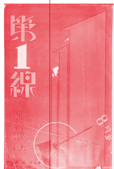
[그림 10] (왼쪽) 『제일선』 1932년 12월호, (가운데) 1933년 7월호, (오른쪽) 8월호, 국립중앙도서관