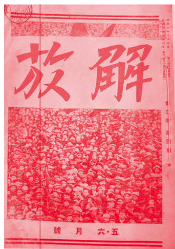
[그림 9] (왼쪽) 『해방』 창간호 1930년 12월 호, 서울대학교 중앙도서관 (오른쪽) 『시대의 얼굴』 1931년 5-6월 합호