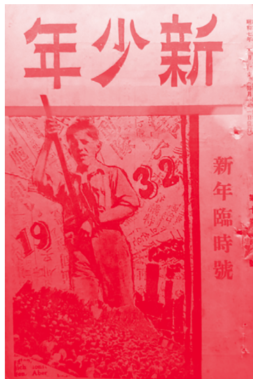
[그림 7] 신배균, 『신소년』, 1932년 1월호, 서울대학교 중앙도서관