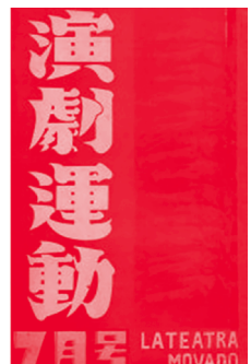
[그림 12] (왼쪽) 『전선』, 1933년 1월호, 서울대학교 중앙도서관, (오른쪽) 『연극운동』, 1932년 7월호, 현담문고