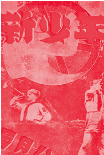
[그림 6] (왼쪽) 신배균, 『신소년』, 1932년 8월호, 서울대학교 중앙도서관, (가운데) 『신소년』, 1932년 9월호, 『시대의 얼굴』, (오른쪽) 이주홍, 『신소년』, 1933년 7월호, 서울대학교 중앙도서관