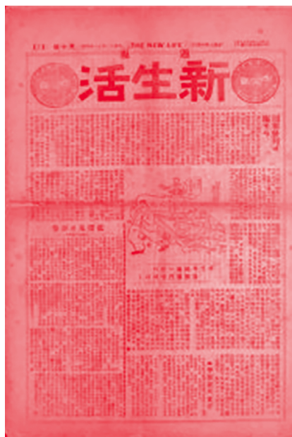
[그림 1] 『신생활』 9호와 10호 표지, 1922

1920년대에는 사회주의가 국내에 수용되면서 여러 단체에 의해 사상운동이 적극적으로 실천되었고, 계몽과 선전이 중요시됨에 따라 관련 출판물이 다수 간행되었다.