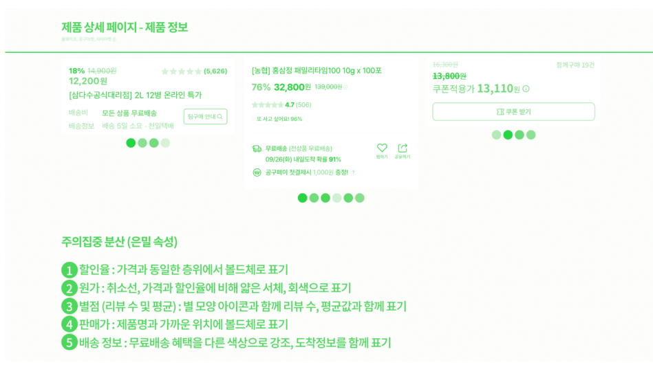
[그림 5] 제품 설명에 나타난 주의집중 분산 다크패턴 43)