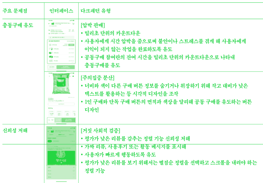
[표 7] 다크패턴 유형별 사례와 문제점 도출 37)

제외하고 정보의 위치와 글자의 크기가 상당히 유사한 인터페이스를 공유하고 있으며, 공통적으로 현재 참여가능한 팀 구매의 남은 시간을 밀리초 단위의 카운트다운으로 표시하고 있다. 반면 사자마켓의 경우, 카운트다운을 표시하는 대신 현재 참여가능한 팀 목록을 제시하는 방식을 통해 사용자의 팀 구매를 유도하고 있다.