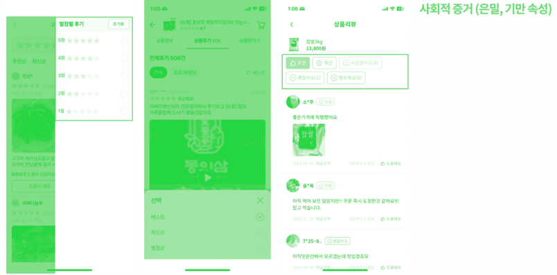
[그림 8] 리뷰 페이지에 나타난 거짓 사회적 검증 다크패턴 50)

사용자 간의 신뢰를 저해할 가능성이 있다. 특히 전자 상거래에서는 오프라인 거래와는 달리, 구매자가 제품을 눈으로 직접 확인하고 살 수 없기 때문에 신뢰가 더욱 중요한 요인으로 강조되며, 구매에 영향을 미치는 핵심 요인으로 작동한다. 52) 이외에도 신뢰는 공동구매 플랫폼에서 지속사용의도와 플랫폼 애착에 유의한 영향을 미치기 때문에, 공동구매 플랫폼에서는 서비스를 적극적으로 관리하고 유지해 신뢰를 확보해야 하는 필요성이 존재한다. 53) 하지만 다크패턴은 소비자를 속이고 판매자에게 유리한 특정한 행동을 하도록 유도하도록 의도된 디자인이기 때문에, 소비자가 사용자 인터페이스에 나타난 다크 패턴을 인지하게 되면 해당 플랫폼에 대한 신뢰를 잃게 되는 결과로 이어질 수 있다.