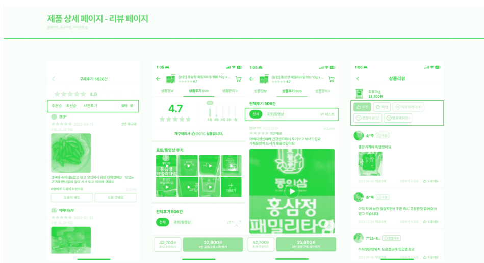
[그림 7] 제품 상세 페이지의 리뷰 페이지 인터페이스 49)

이처럼 다크패턴 중 압박 판매, 주의집중 분산 유형의 경우 소비자의 공동구매를 유도하고, 거짓 사회적 검증 유형은 구매 결정에 중요한 고려 요소인 이용 후기의 일부를 은폐하는 방식으로 소비자를 기만한다. 51) 이러한 소비자 기만은 공동구매 플랫폼과