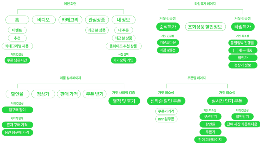
[그림 1] '올웨이즈'의 주요 기능에서 나타나는 다크 패턴 유형

10월 현재 국내에서 다운로드 수가 높은 공동구매 서비스를 선정했고, 그 결과 10위권 내의 공동구매 서비스 올웨이즈와 그다음으로 순위가 높은 공구마켓이 선정되었다. 그리고 기준③을 통해 사용자 인터페이스가 유사한 올웨이즈와 공구마켓 외에도 사자마켓을 선정해 다크패턴 유형에 대한 비교가 용이하도록 연구 대상을 선정했다.