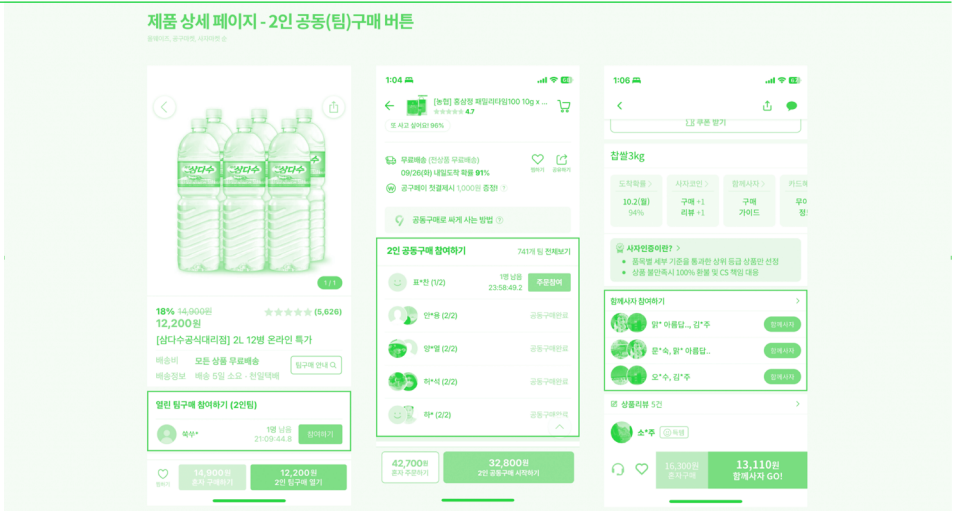
[그림 2] 제품 상세 페이지의 팀 구매 참여 인터페이스 38)