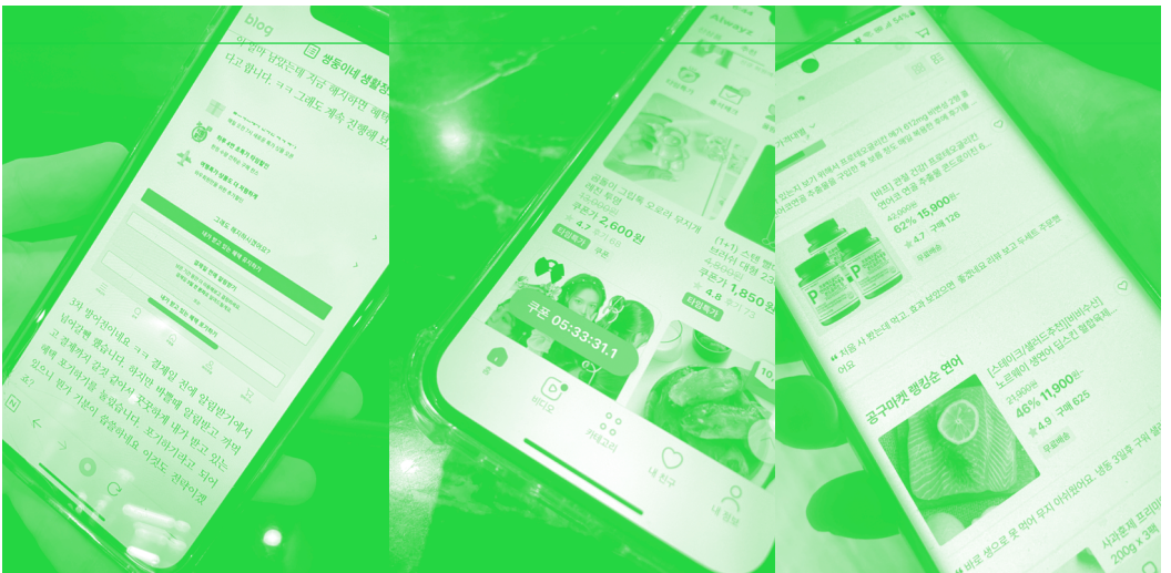
〈그림 10〉 인터뷰 진행 중 제시된 다크 패턴 인터페이스 사례

“나는 편리함을 위해 이 서비스를 사용하는데 이 서비스가 오히려 나를 방해한다면 서비스를 사용하는 입장에서 그것을 감수해야 하기