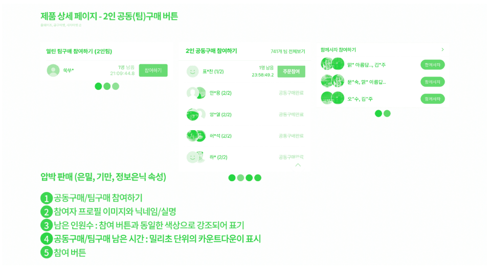
[그림 3] 팀 구매 참여에 나타난 압박 판매 다크패턴 39)