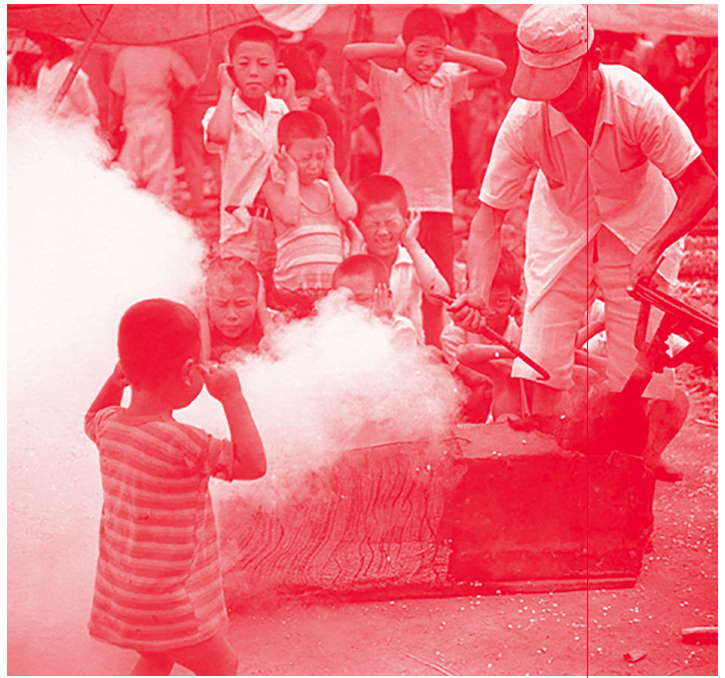
[그림 4] 곡물이 ‘뽕’ 소리와 함께 터지는 장면

뽕튀기는 압력을 이용해 곡물을 튀겨 만든 과자를 총칭하는 용어이다. 뽕튀기 기계에 곡물을 넣고 밀봉한 뒤 열을 가하면, 곡물 내부의 공기가 팽창하며 높은 압력을 받게 된다. 이때, 기계의 뚜껑을 열면 압력이 순식간에 낮아지면서 곡물이 팽창하며 ‘뽕’ 소리와 함께 터진다. [그림 4] 뽕튀기는 사용된 곡물에 따라 맛과 향, 형태가 달라지며, 현대에 들어서는 그 종류가 더욱 다양해졌다. 원재료의 가공 여부에 따라 뽕튀기를 여러 가지로 분류할 수 있다. 가장 기본적인 형태는 곡물을 처리하지 않고 원형 그대로 사용하는 것이다. 예를 들어 쌀을 튀겨 만든 튀밥(쌀 뽕튀기)은 곡물의 본래 맛과 모양을 그대로 유지한다. 또 다른 예로, 옥수수를 사용한 강냉이(옥수수 뽕튀기)가 있다. 강냉이는 옥수수를 사용한다는 점에서 팝콘과 비슷하지만, 사용하는 옥수수의 품종이 다르다. 곡물 원형을 유지하지 않고 가공 과정을 거쳐 튀겨낸 뽕튀기도 있다. 여러 개의 곡물을 동시에 틀에 넣고 압착하면 우리가 흔히 보는 원형 뽕튀기(쟁반 뽕튀기, 접시 뽕튀기 등)가 된다. 떡뽕(떡튀밥)은 떡국떡을 튀겨낸 것으로 백미를 주재료로 하는 뽕튀기이다. 소화가 쉬워 유아용 과자로 많이 소비된다. 반죽하는 과정을