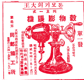
[그림 2] 곡물팽창기 광고, 《동아일보》, 1932.1.28.