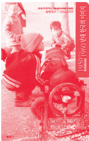
[그림 6] 공중전화카드