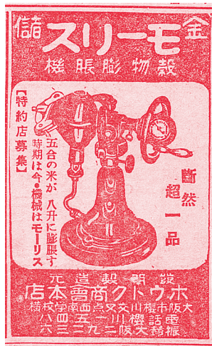
[그림 1] 곡물팽창기 광고, 《경성일보》, 1931.10.30.

한국에서 뽕튀기 기계에 대한 최초의 기록은 1931년 10월 30일 자 《경성일보》 광고[그림 1]에서 찾아볼 수 있다. 광고문구에는 “돈벌이 모리스 곡물팽창기, 오합의 쌀이 여덟 되로 팽창하다”라는 내용이 등장하며, 열 배 이상 부풀려준다는 점을 강조했다. 이 광고와 함께 소개된 곡물팽창기 삽화는 현대 뽕튀기 기계의 원형으로 볼 수 있다. 1932년 1월 28일 자 《동아일보》에 실린 곡물팽창기 광고에서도 “돈 모으기의 제약”, “곡물팽창기에 불황 없다” 등의 문구가 등장해 장사꾼을 대상으로 홍보하는 것으로 보인다. [그림 2] 더불어 1938년 《조선일보》의 독자