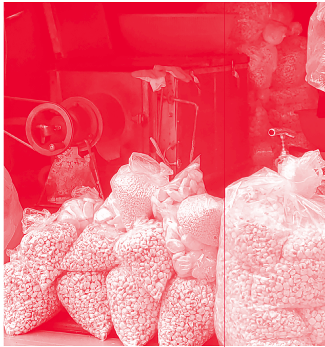
[그림 5] 뽕튀기 종류

“장마가 끝나고 화창한 날 헛간을 정리하던 내가 부상 당한 비닐우산을 한 아름 꺼내 옥수수튀김과 바꾸었다. 동생 이름이