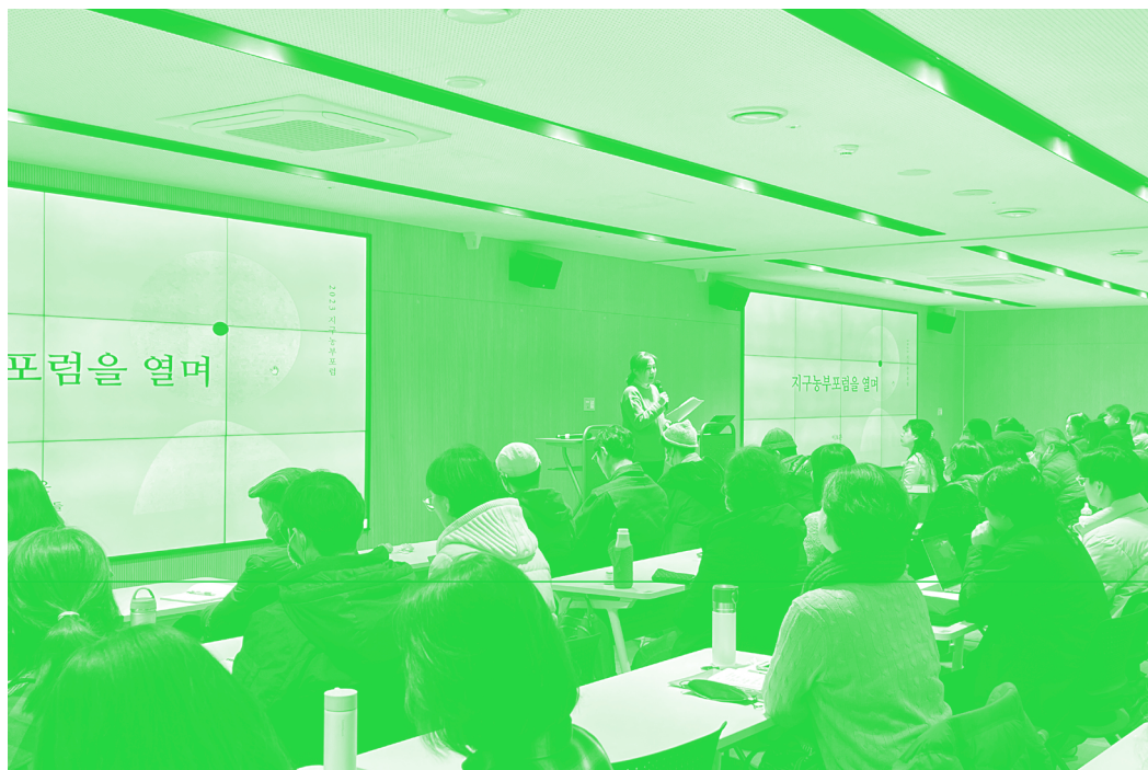
〈그림 8〉 마르쉐 지구농부 포럼 장면