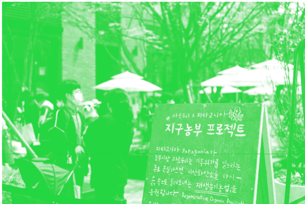
〈그림 3〉 마르쉐와 파타고니아가 함께 한 지구농부 프로젝트