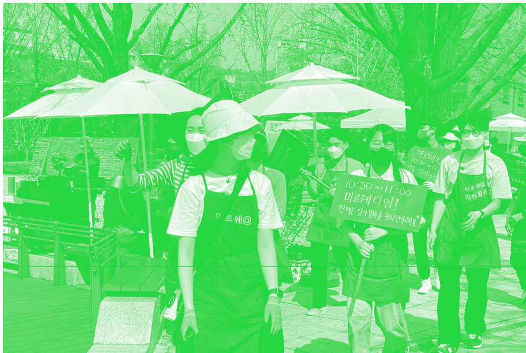
〈그림 5〉 마르쉐 시장 모습