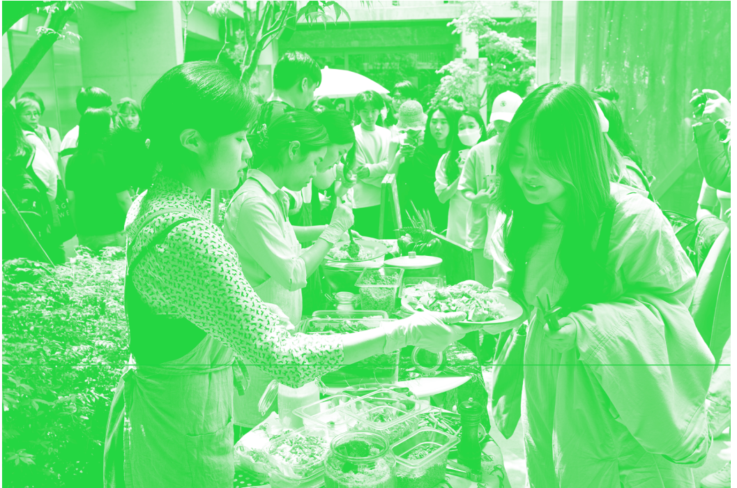
〈그림 4〉 마르쉐 시장 모습