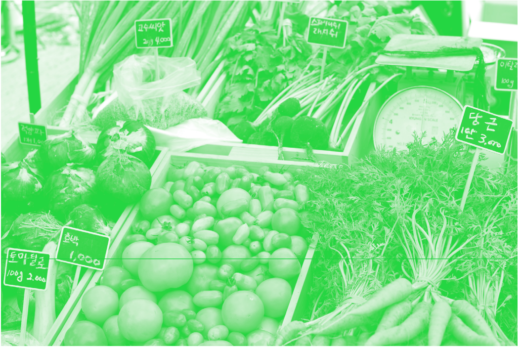
〈그림 2〉 농부가 직접 재배한 채소들