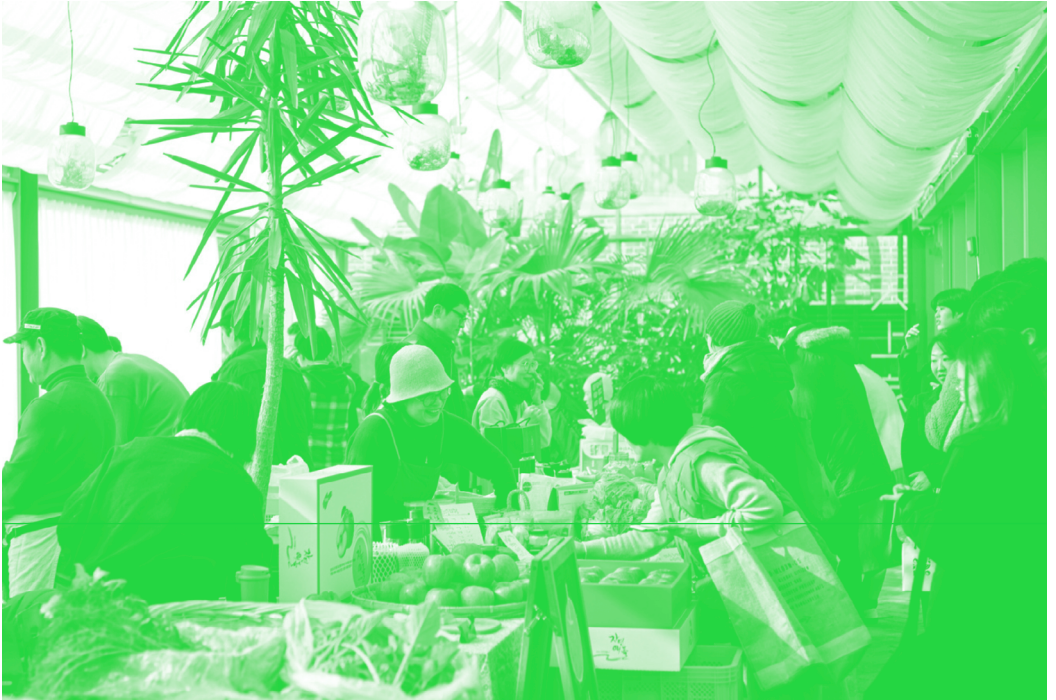
〈그림 6〉 마르쉐 시장 모습