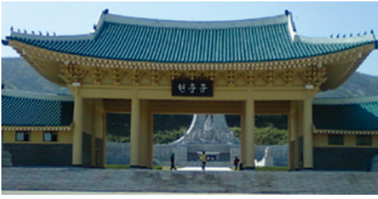
[그림 12] 국립헌정총원(대전, 1979)