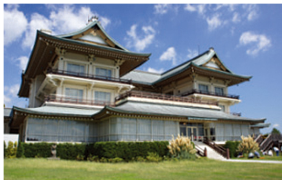
[그림 4] 비와호 호텔(琵琶湖ホテル, 1934)

비와호 호텔(琵琶湖ホテル, 1934)[그림 4], 가마고리 관광호텔(蒲郡観光ホテル, 1934), 여성 회관(女子会館, 1936) 등이 있다.