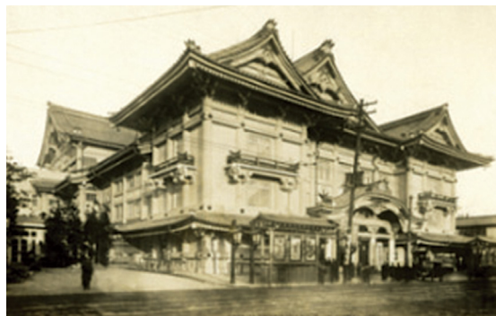
[그림 3] 가부키 극장(歌舞伎座, 1924)

그러던 중 1920-30년대에 걸쳐 일본에서 고전건축이 쇠퇴하고, 모더니즘 양식이 도입되는 등 다양한 건축 양상이 전개되기 시작했다. 동시대 서구에서는 아르누보 열풍이 지나가고, 아르데코 양식이 유행하고 있었다. 일본에서는 하나의 건물에 여러 양식이 결합하는 경우가 종종 생겨났는데, 특히 주목할 부분은 서구 신고전주의 건물에 일본 전통요소를 혼합하는 경향이다. 파시즘이 극에 달하던 1930년대, 이토 주타(伊東忠太), 사노 토시카타(佐野利器), 다케다 고이치(武田五一) 등의 건축가들이 ‘화양절충(和洋折衷) 3) ’의 건축 양식을 주장하기 시작했다. 그리고 이들이 심사위원을 맡은 건축설계공모에서는 서양식 철근콘크리트 건축에 일본식 지붕을 얹은 건축물이 다수 선정되었다. 건축물 상단에 올려진 일본식 지붕을 황제의 왕관에 빗대어, ‘황제의 왕관’ 양식, 즉 ‘제관양식(帝冠様式, ていかんようしき)’이라 부르기 시작했고, 1930년대 일본의 대표적인 건축경향으로 자리 잡았다. 대표적인 예로, 가부키 극장(歌舞伎座, 1924)[그림 3], 시바구청(芝区役所, 1929), 동방문화 동경연구소(東方文化東京研究所, 1933),