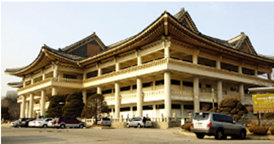
[그림 14] 어린이회관(서울, 1975)

간결한 기둥이 자리 잡고 있다. [그림 12] 비슷한 시기에 지어진 여타 기념 건축물의 구성도 거의 동일하며, 공통으로 계란색을 사용하고 있어, 그 뿌리가 일제임을 추정케 한다. [그림 13, 14] 물론 해당 건축 설계 당시 전통을 현대적으로 재해석하는 방법이 제한적이고, 제관양식 건축이 모두 공통적으로 계란색만을 쓴 것이 아니므로, 몇 가지 이유만으로 일본의 모방이라고