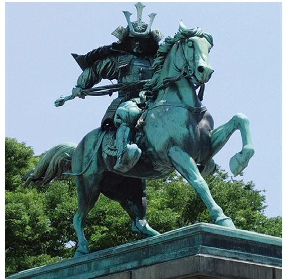
[그림 15] 일본 황궁 내, 구스노키 마사시게(楠木正成) 동상

박정희 대통령이 과거 만주국 신경육군군관학교를 다닌 시기가 1940-42년이며, 동경에서 일본 육사를 다닌 시기는 1942-44년까지이다. 당시 일제 괴뢰국가로 건국된 만주국(1932-45)은 한참 거대 토건사업을 통해 새로운 사회가 건설되고 있던 시기였고, 새로 지어진 각종 거대 건축물이나 기념비들은 제관양식의 만주국 버전인 홍야양식을 띠고 있었다. 또한 박정희 대통령이 동경에 머문 시기는 막 제관양식의 열풍이 지나간 시기로 새롭게 단장한 수많은 제관양식 건축물을 쉽게 만날 수 있는 시기였다. 이 시기 일본이 서구의 근대를 오해하며 모더니즘이 아닌 신고전주의를 무비판적으로 수용하듯, 제관양식을 일본의 근대문물로 오해하여 당시 조선인들에게 깊은 각인을 남겼을 수 있다. 이러한 추측에 힘을 보태주는 사례는 여러