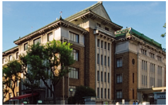
[그림 5] 군인회관(小野武雄, 1934)