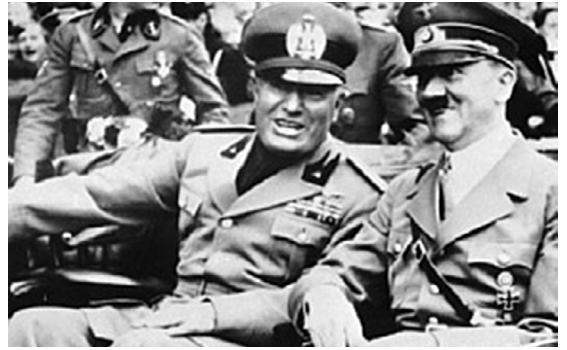
[그림 1] 무솔리니와 히틀러의 모자에 새겨진 독수리 문양

역사적으로 등장하는 대부분의 조형작품은 당대를 대표하는 특정한 스타일(양식)을 따른다. 디자인 양식은 개인별 취향의 차이가 있을 수는 있겠으나, 그 자체로 옳고 그름을 논할 수 없다. 신고전주의가 옳다거나 모더니즘이 나쁘다는 식의 윤리적 판단은 지극히 정치적인 행위다. 특수한 정치·사회상황에 따라, 특정 디자인 양식이 특정한 정치성을 띠거나, 상징성을 가지게 될 경우 양식의 우열을 논하기도 했다. 순수미술에서는 냉전시기, 사실주의와 추상미술이 각각 자유주의와 사회주의의 대표양식으로 선전되며 서로를 부정하는 상황을 초래했다. 히틀러(Adolf Hitler)는 과거 신성로마제국(962-1809)이 정복지를 억압하고 제국의 위용을 과시하던 건축 양식과 상징을 차용하여 독일 나치의 정치 선전물로 활용했다. 나치 시대 건축물은 늘 건축 이면에 내재한 권력의 의도에 대한 평가가 우선되었고, 디자인 양식에 대한 부정적 평가가 뒤따랐다.