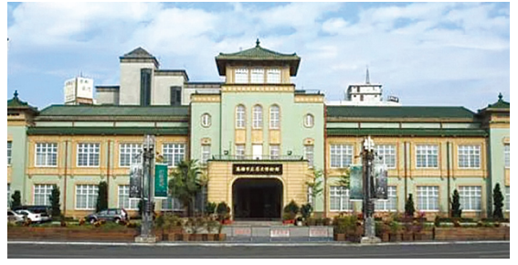
[그림 8] 대만 가오송 시립역사박물관(1939)

일본풍이 뒤섞인 지붕을 올렸다. [그림 7] 8) 이러한 현상은 일본의 식민지였던 대만에서도 다수 발견된다. [그림 8]