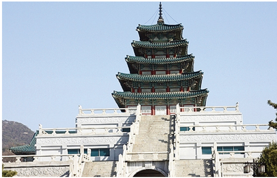
[그림 9] 국립민속박물관(구 국립중앙박물관, 1972)

정체성을 나타내는 색상으로 보았던 당시 미술계의 분위기도 일조하였을 뿐만 아니라, 과거 일제 문화통치기의 야나기 무네요시에 의해서 규정된 조선의 미가 확대 재생산된 것으로 볼 수도 있다. 혹은 무채색만을 소위 ‘착한’ 색상으로 규정했던 모더니스트들의 영향일 수도 있다. 하지만, 베이지색은 어디에서 유래된 것인지 불명확한데, 여러 곳에 광범위하게 사용된 것은 쉽게 확인할 수 있다. 일설에는 육영수 여사가 가장 좋아했던 색이라 채택되었다고도 한다. 아무튼 ‘한국적 건축’뿐만 아니라, 새마을 운동 접미에서 시골 마을 어귀에 만들어진 공동변소에 이르기까지 베이지색은 군부가 가장 좋아하는 색상으로 자리 잡았다.