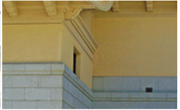
[그림 11] 유슈칸(遊就館, 1931) 전경과 유슈칸의 일부

계란색을 칠한 건축물을 ‘박조(朴朝) 건축’이라고 폄하했다. ‘한국적 건축’은 분명 1960-70년대 오랜 시간 동안 한국 근대의 외형을 형성하는 중요한 사건이었음에도 군부가 왜 그런 조건을 내세웠는지, 누구의 생각이었는지에 대한 자료는 남아있지 않다. 단순히 군부의 무지에서 비롯된 설계요건에, 당시 정권에 동조한 일부 건축가들에 의해서 자발적으로 제시된 적당한 선의 야합이자, 절충선 정도로 인식될 뿐이다.