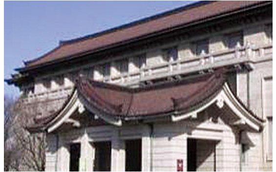
[그림 6] 동경국립박물관(東京国立博物館, 渡辺仁, 1937)

심사관의 심사경향을 통해 건축양식은 통제되는 셈이나 마찬가지였다. 1926년 가나가와현 청사, 1930년 나고야 시청의 설계경기 규정에 일본 취미를 반영하라는(일본식 지붕을 올리라는) 내용이 포함되어 있지 않았다. 하지만, 줄곧 이러한 작품들이 입선하자, 점차 그 출품 비율이 늘어나기 시작했다. 나고야 시청 설계경기에서는 여덟 개 안 중 세 개 안만이 제관양식이었던 것이, 군인회관에 이르러서는 입선 안 10점 전부가 일본색을 반영하고 있었다. 이러한 경향에 반대하고 모더니즘 건축을 지향하는 젊은 건축가들은, 일본 전통건축은 목재에 어울리는 조형으로 철근 콘크리트에는 어울리지