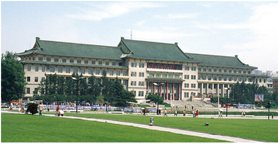
[그림 7] 만주국 황궁(1938-), 현 중국 장춘지질학원(만주국 흥야양식)