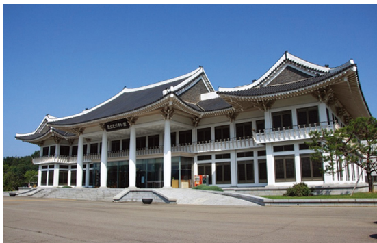
[그림 10] 광주박물관(1978)

1970년대에는 전국 각지에 많은 박물관이 건립되어 역사와 문화에 대한 계몽에 박차를 가하였다. 부여 박물관(1971), 국립 중앙박물관(1972), 공주 박물관(1973), 경주 박물관(1975), 부산 시립박물관과 광주 박물관(1978)[그림 10] 등 수많은 박물관이 새로 신축되었는데, 당시 공공건물의 설계 지침에는 “한국성의 표현, 재창조, 승화”와 같은 식으로 표현되어 직접적으로 민족주의를 강요하였고, 대부분의 건축물에 이러한 요구사항이 어김없이 반영되었다. 1966년 중앙박물관은 현상 공모 당시에 주관 관청이 제시한 설계 조건이 “건물 외형은 지상 5층 내지 6층, 지하 1층 건물로 그 자체가 어떤 문화재의 외형을 모방해도 좋음”, “건물 자체가 어떤 문화재의 외형을 모방함으로써 콤포지션 및 질감이 그대로 나타나게 할 것”이었다. 구체적으로 어떤 스타일의 건물을 지을 것인지를 규정해주고 있다. 결국 ‘불국사’, ‘삼국 시대의 기단’, ‘경복궁 근정전의 난간’, ‘법주사 팔상전’, ‘화엄사 각황전’ 등 9개의 전통건축을 조합하여 콘크리트로 모사하는 결과를 낳았다. [그림 9] 이후 이 건물이 하나의 전형이 되어 공공건축물에 전통 모사적인 형식이 범람하게 된다. 일부 건축가는 정부의 이러한 규정에 반발하여 공모전에 불참하기도 했지만, 대부분의 ‘배고픈’ 건축가들은 정부가 발주하는 대형 국책사업을 못 본 척할 수만은 없는 상황이었다.(김종균, 2013)