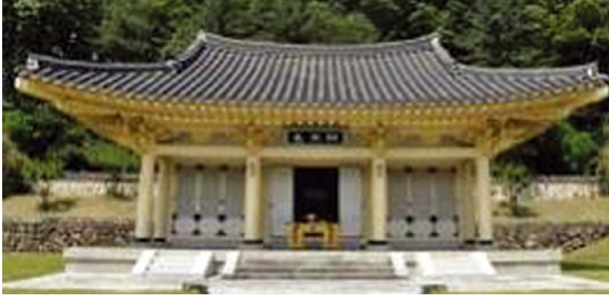
[그림 13] 총렬사(부산, 1978)